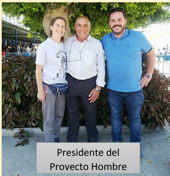
Presidente del Proyecto Hombre

Con el fin de recaudar la mayor cantidad de fondos posibles para ayudar a La Asociación Fortaleza de la Axarquía (AFAX Proyecto Hombre), cuyo principal objetivo es trabajar con un sistema terapéutico de rehabilitación de drogodependientes, mejorando la calidad de vida de estas personas.