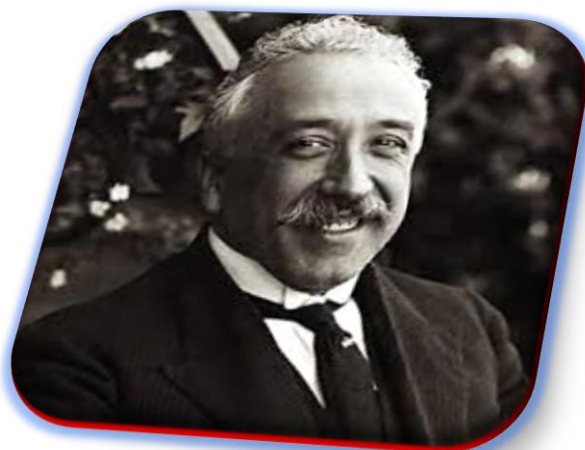
-D. Niceto Alcalá-Zamora y Torres-

“La salud de la democracia es un pueblo educado”.